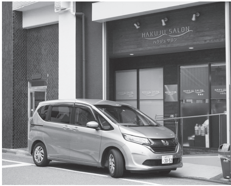
送迎にもあえて普通車を使用する「ハクジュサロン板橋」

人ひとりのココロもカラダを温められるサービスを目指しています。また、介護予防・自立支援の考えを大切にしています。当たり前のことですが、ご自身でできることは積極的にこなしていただければ、常にスタッフ一同心掛けています。